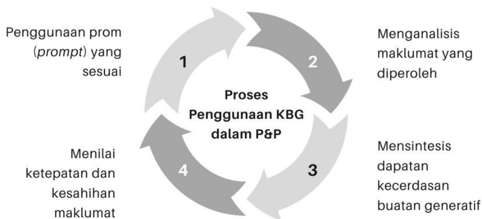
Rajah 1. Proses penggunaan KBG dalam P&P

2.2.4 Penggunaan KBG perlu dioptimumkan dengan mengulangi proses penggunaan prom ( prompt ) yang sesuai, menganalisis maklumat yang diperolehi, mensintesis (contoh: mengubahsuai, menggabung, mengolah, menggabung jalin) dapatan KBG, menilai ketepatan dan kesahihan maklumat bagi mendapatkan hasil yang tulen dan asli seperti ditunjukkan dalam Rajah 1.